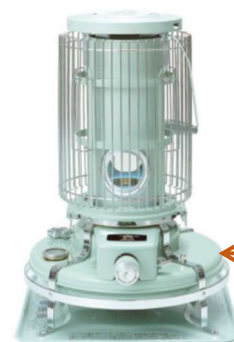
表示位置：置台の後側